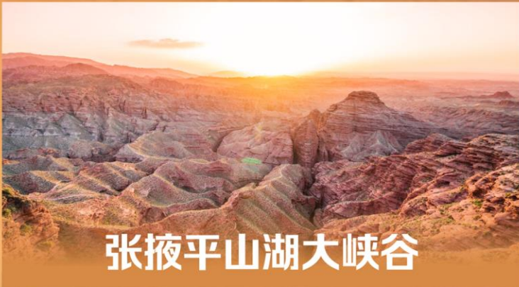
张掖平山湖大峡谷