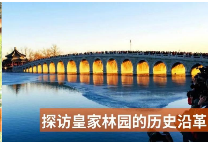
探访皇家园林的历史沿革